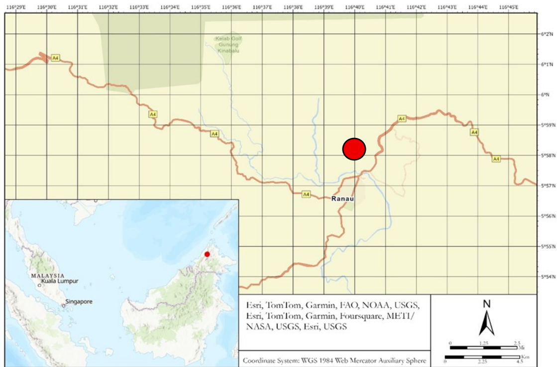
Rajah 1 Peta Kawasan kajian di Mibang, Ranau, Sabah

Dalam formula Faktor Bioakumulasi (BAF) ini, C tumbuhan mewakili konsentrasi logam berat dalam bahagian boleh dimakan tumbuhan, manakala, C tanah mewakili konsentrasi logam berat dalam tanah. Bahagian tumbuhan yang dikaji adalah rizom bagi halia dan batang bagi serai. Untuk memastikan ketepatan analisis tanah dan tumbuhan dalam kajian ini, analisis kosong disertakan semasa proses pengestrakan.