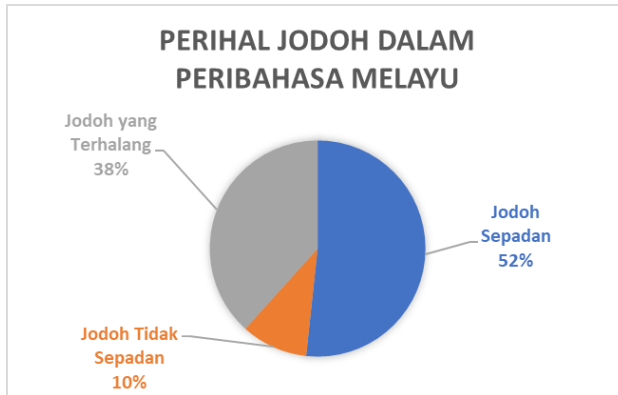
Rajah 2 Carta Pai Bilangan Peribahasa Perihal Jodoh Mengikut Tema