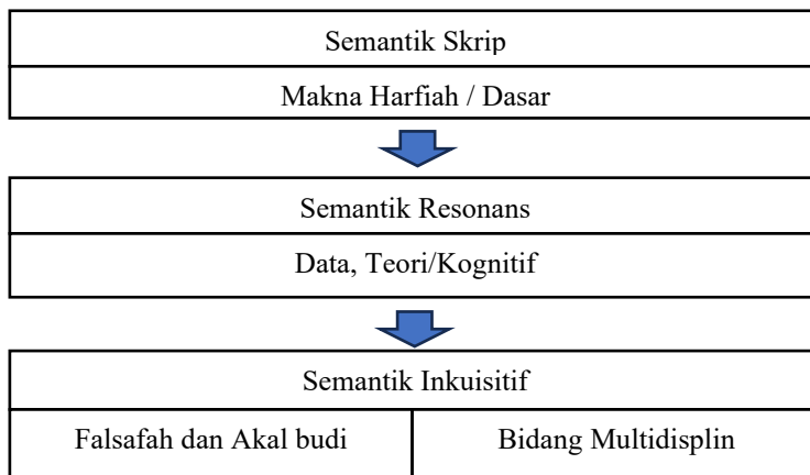
Rajah 1 Kerangka Semantik Inkuisitif (Nor Hashimah Jalaluddin, 2017)

Seterusnya, analisis data dilakukan dengan mengaplikasikan pendekatan Semantik Inkuisitif (Nor Hashimah Jalaluddin, 2017) bagi mencapai objektif kajian, sekali gus menelusuri makna peribahasa secara mendalam. Proses penganalisan data dalam kajian ini merangkumi tiga tahap utama, iaitu semantik skrip, semantik resonans, dan semantik inkuisitif. Semantik skrip melibatkan pemerhatian terhadap struktur dan elemen leksikal dalam peribahasa atau dikenali sebagai makna harfiah peribahasa itu sendiri. Seterusnya, semantik resonans meneliti bagaimana makna peribahasa ditafsirkan oleh penutur berdasarkan pengalaman dan konteks hidup mereka. Semantik resonans dalam kajian ini diperoleh daripada data korpus Dewan Bahasa dan Pustaka. Akhir sekali, semantik inkuisitif digunakan untuk mencungkil falsafah dan akal budi Melayu yang tersirat dalam peribahasa, dengan memberi fokus kepada nilai, budaya, dan kebijaksanaan yang mendasari ungkapan tersebut.